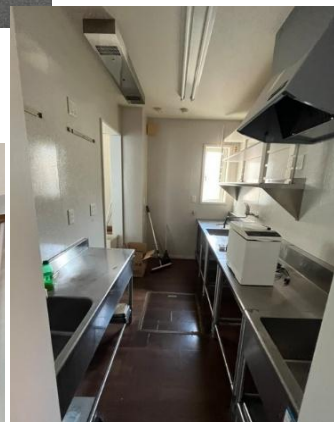
2階スタッフルーム→